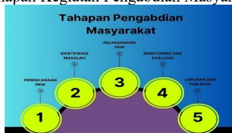
Gambar 1. Tahapan Kegiatan Pengabdian Masyarakat