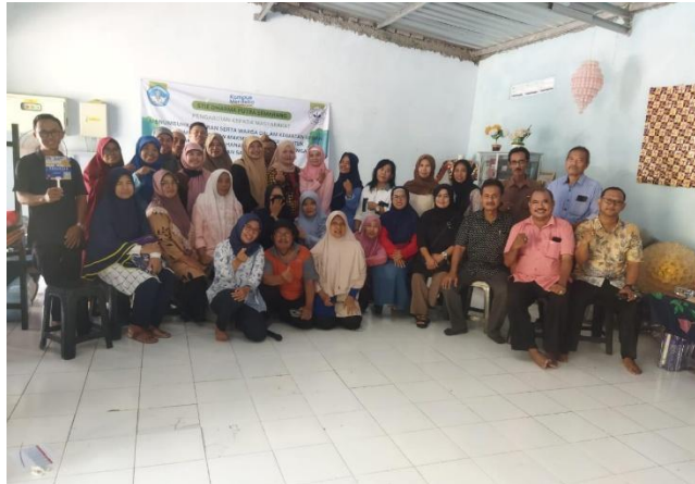
Gambar 6. Foto bersama tim pengabdian dengan peserta pengabdian

keinginan, maka bisa di download hasil editan tersebut yang ditunjukkan pada gambar berikut :