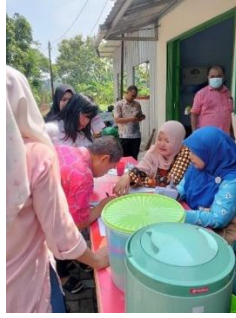
Gambar 2. Peserta melakukan presensi kehadiran

Pada gambar 2 diatas adalah peserta kegiatan saat melakukan presensi kehadiran. Materi yang disampaikan yaitu bagaimana memanfaatkan aplikasi Canva dalam membuat iklan produk, cara mengedit dan operasi aplikasi Canva, dan mendownload hasil editan (konten). Paparan kegiatan dapat ditunjukkan pada gambar berikut :