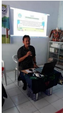
Gambar 3. Pelatih memberikan pelatihan

Pada gambar 2 diatas adalah peserta kegiatan saat melakukan presensi kehadiran. Materi yang disampaikan yaitu bagaimana memanfaatkan aplikasi Canva dalam membuat iklan produk, cara mengedit dan operasi aplikasi Canva, dan mendownload hasil editan (konten). Paparan kegiatan dapat ditunjukkan pada gambar berikut :